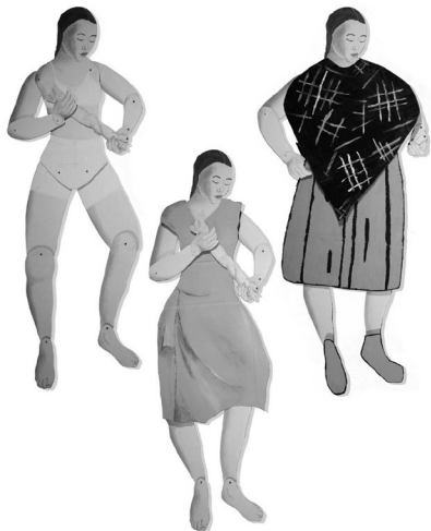
Figura 3. Marioneta de papel y cartón pintado inspirada en Rosario de Velasco