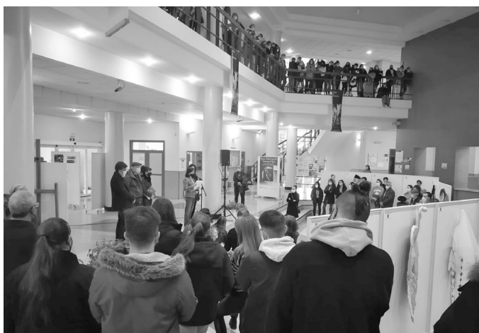
Figura 4. Inauguración de la exposición "Mujeres artistas españolas. Marionetas de papel"

Inauguración con motivo del Día Internacional de Eliminación de la Violencia contra las Mujeres, el 24 de noviembre de 2021, en el Centro Multidepartamental de la UAH en Guadalajara.