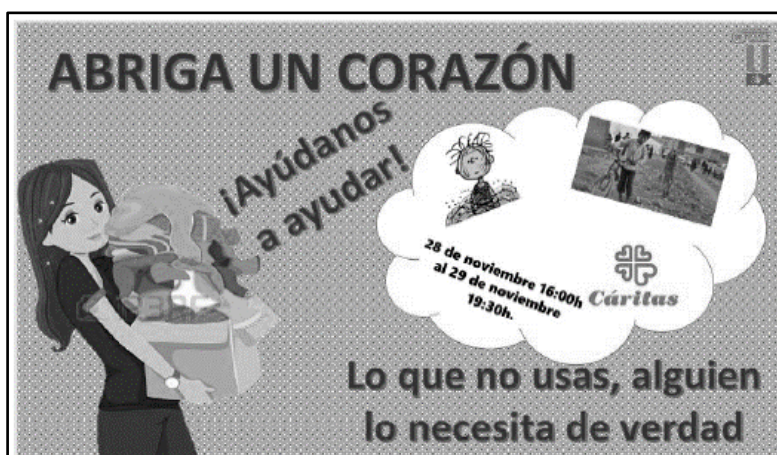
Figura 4. Ejemplo de divulgación del proyecto ApS “Recogida solidaria”.