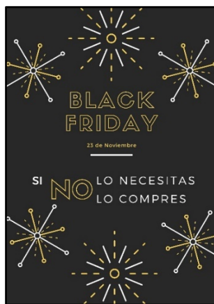
Figura 5. Ejemplo de divulgación del proyecto ApS “Black Friday”.

El análisis global de los 8 proyectos ApS elaborados por los futuros maestros indica que: