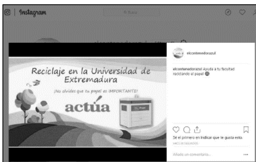
Figura 1. Ejemplo de divulgación del proyecto ApS “Tu papel es importante”.