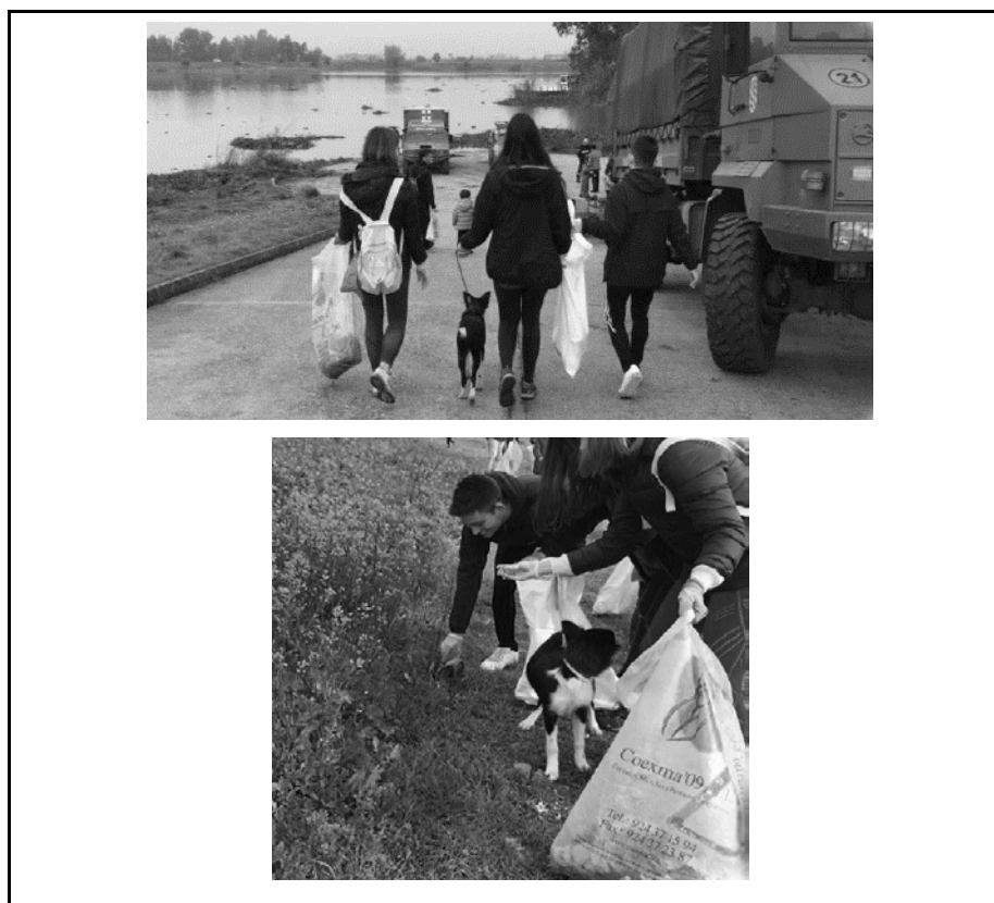
Figura 3. Fotografías de futuros maestros participantes en el proyecto “Tu basura es la de todos” durante la marcha para la recogida de residuos en el paseo del río Guadiana.